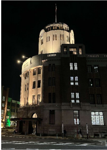
時計塔(ライトアップ)