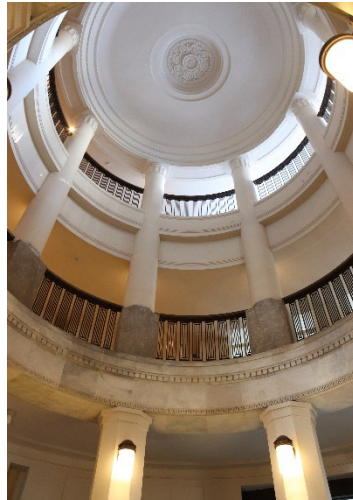
エントランスホール (吹き抜け)